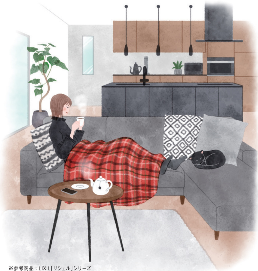
※参考商品：LIXIL「リシェル」シリーズ

発行 (株)丸善遠藤装室 静岡市葵区沓谷6-8-10 TEL (054) 261-1334 FAX (054) 261-1339 http://www.maruzen-endo.co.jp E-mail. livewell@maruzen-endo.co.jp