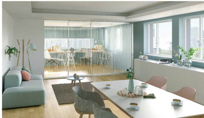
全面ガラスならではの開放感と明るさでおしゃれな空間を演出

近頃は、在宅で仕事や会議をすることが増えました。しかし、住まいの限られた空間に仕事専用の部屋を確保するのは、なかなか難しいもの。そこでおすすめなのが、室内引戸です。リビングなどのスペースを仕切ることで、集中できる空間が生まれます。引戸にはさまざまな素材があります。例えば、全面ガラスで仕切ると、明るさや開放感の邪魔をすることもなく、カフェのようなおしゃれな雰囲気も演出できます。